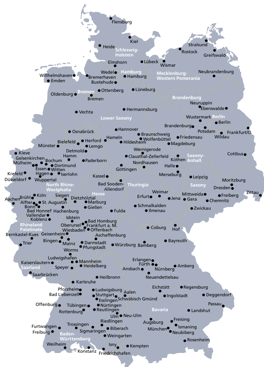
德国高校分布地图